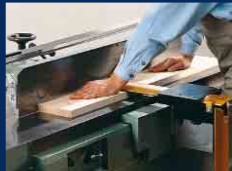
Abrichten breiter Werkstücke mit Schutzbrücke