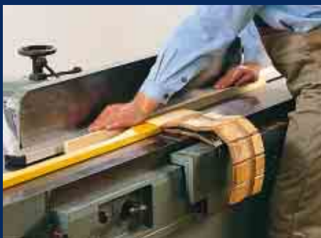
Abrichten und Fügen schmaler Werkstücke mit Fügleiste und Hilfsanschlag