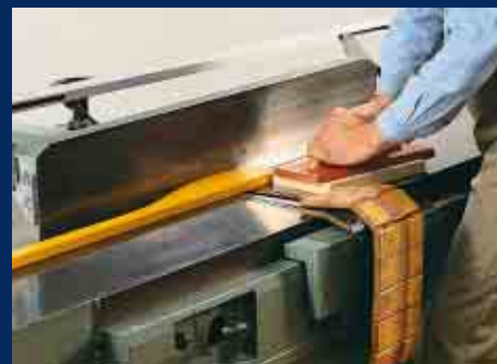
Abrichten kurzer Werkstücke mit Zuführlade