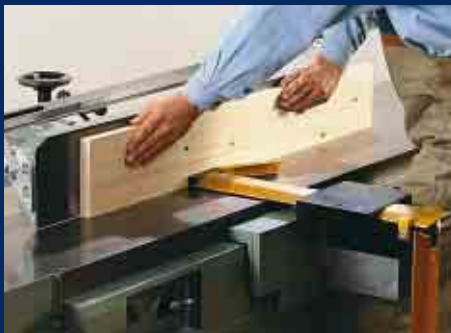
Fügen breiter Werkstücke mit Schutzbrücke