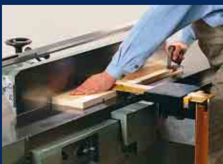
Abrichten kurzer Werkstücke mit Schiebeh Holz und Schutzbrücke