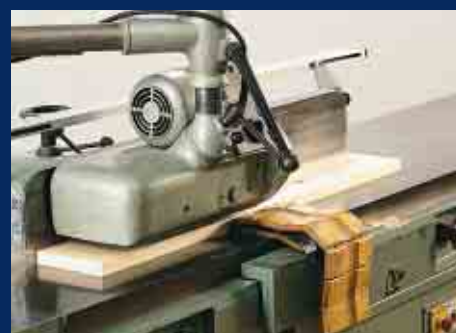
Abrichten von Werkstücken mit dem Vor- schubapparat