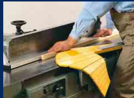
Abrichten und Fügen schmaler Werkstücke mit Gliederschwing- schutz und Hilfsanschlag